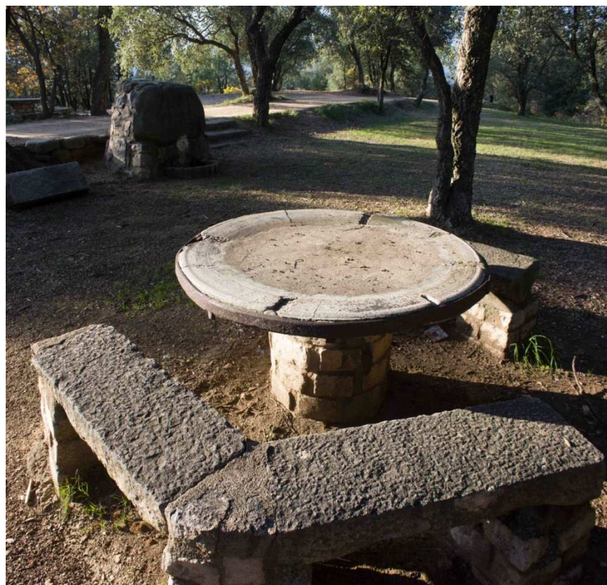
Font de Santa Anna (4)