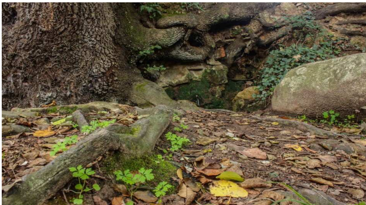
Font d'en Ratica (11)