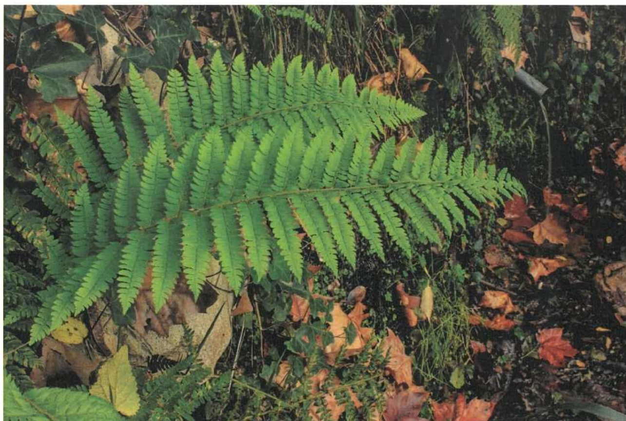
Font de l'Erola (14)