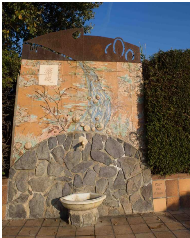
Font d'en Mingo (15)