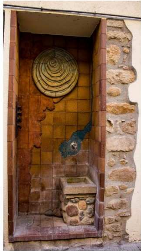
Font del carrer Sant Antoni (5)