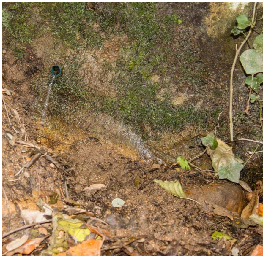
Font de l'Aleix (8)