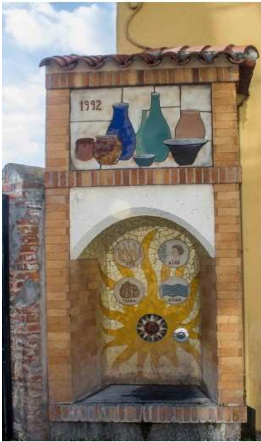
Font del carrer Barcelona (3)