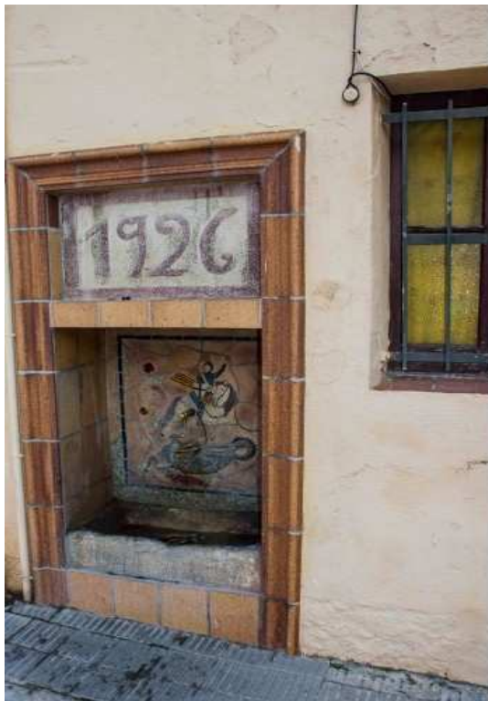
Font del carrer dels Còdols (6)