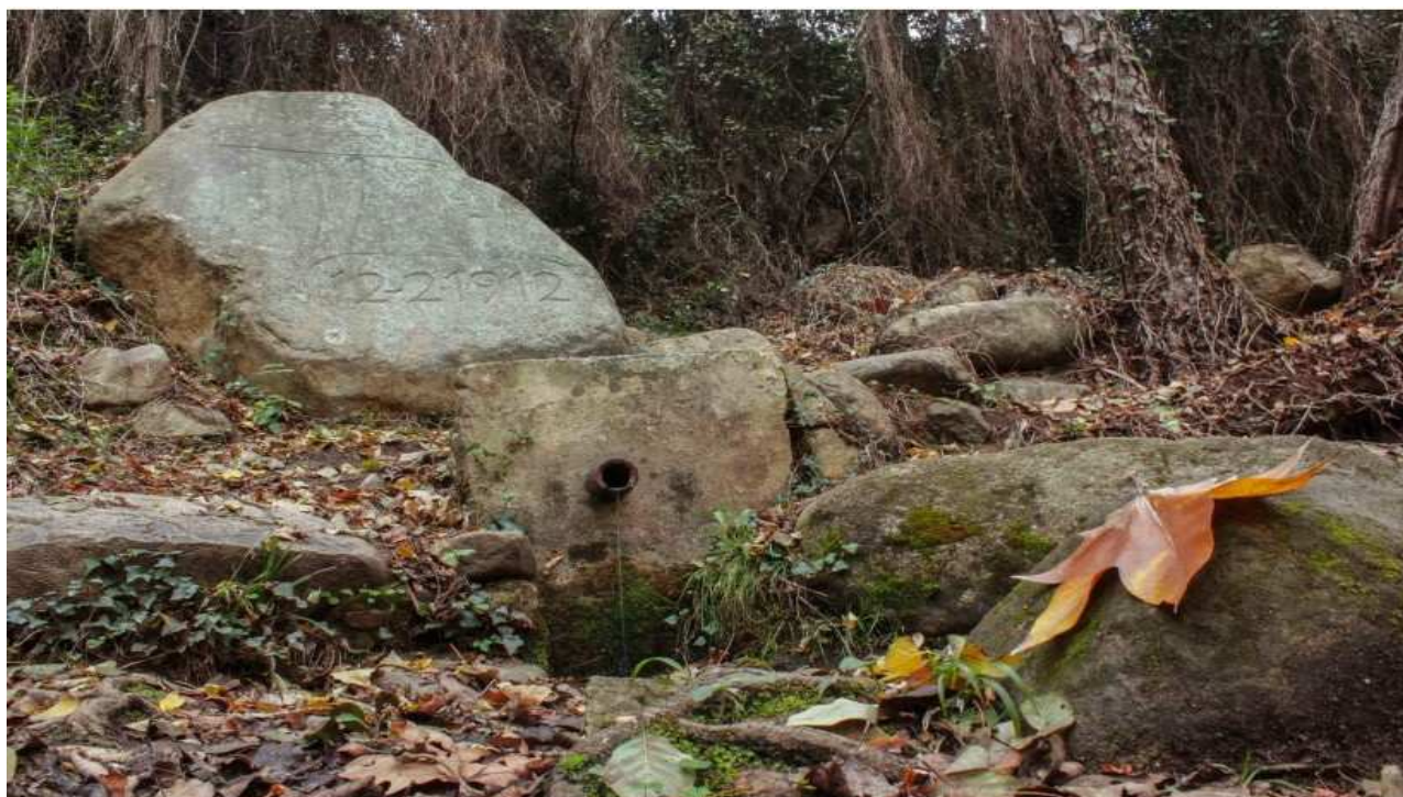
Font de la Pintoresca (13)