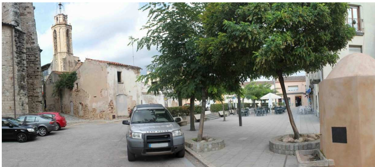
Font de la plaça del convent (1)