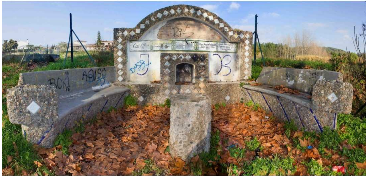
Font de Can Xifré (7)