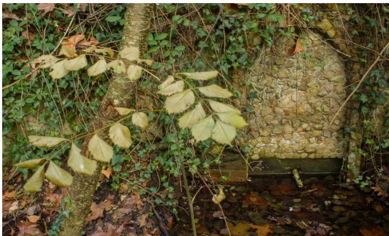
Font de Sant Salvador o Nova(12)