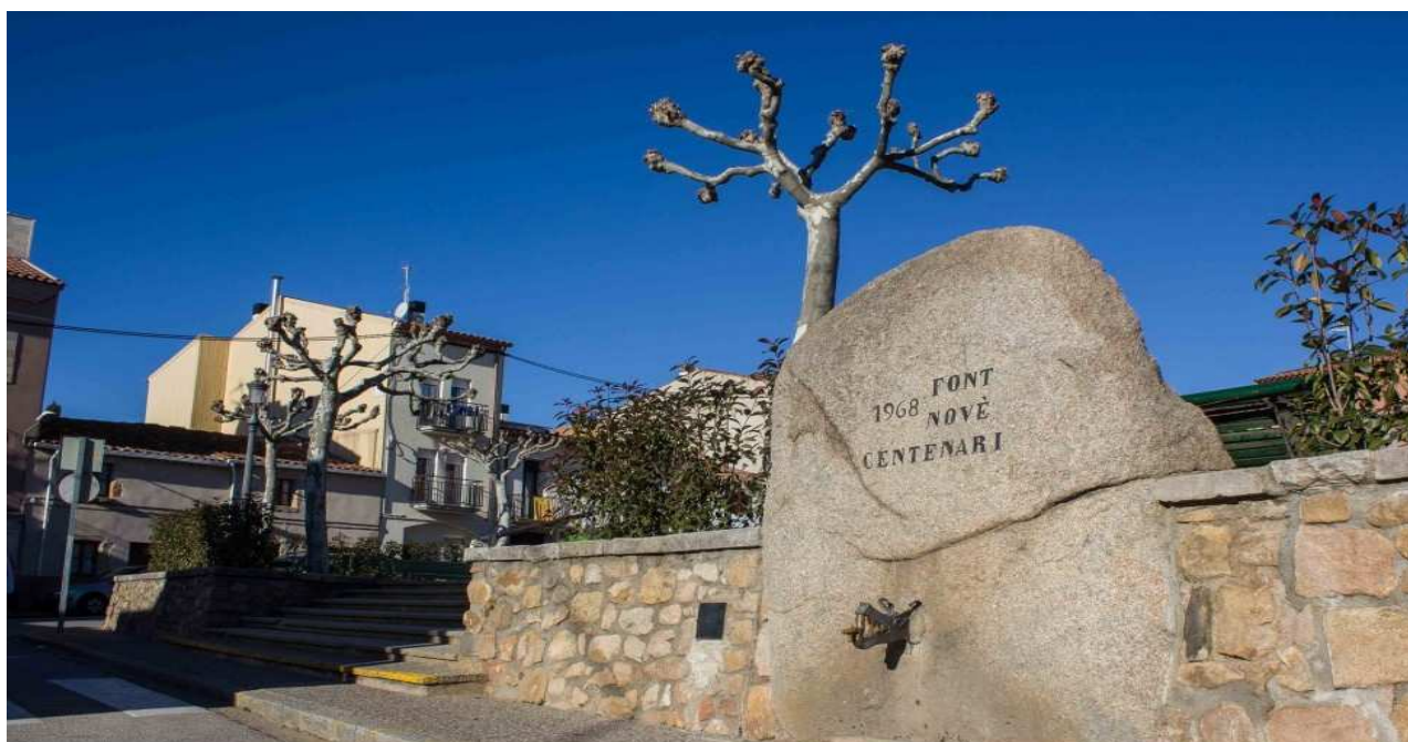
Font del novè centenari (2)